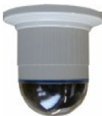
Speed- u. Slow-Domes